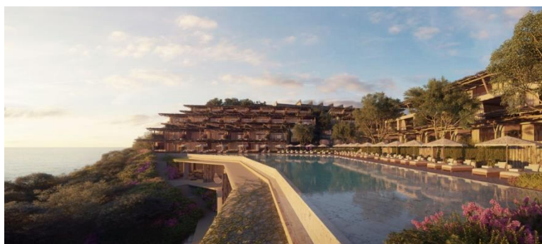
イビサ島北端に位置する秘密の楽園「ザラカ湾」に誕生するシックスセンスズ イビサのメインプール 高解像度の画像はこちら

シックスセンスズ イビサは、空港より車で35分の距離です。リゾートのプライベート送迎サービスをご利用いただけます。預言者ノストラダムスは、イビサ島を“地上最後の隠れ家”と記しましたが、同島に訪れた人は誰もこの予言を否定しないでしょう。