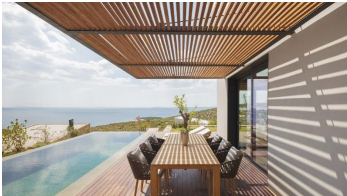
全施設、キッズ向けアクティビティ、サステナビリティ活動を提供中のシックスセンス カプランカヤ 高解像度の画像はこちら