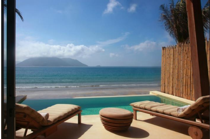
“魂を癒すベトナム”を体験できるシックスセンス コンダオとシックスセンス ニンバンバイ 高解像度の画像はこちら