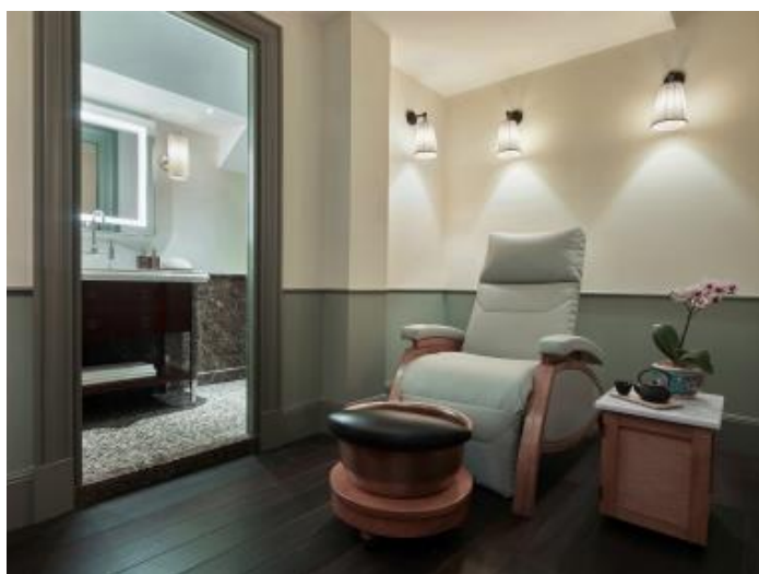
シックスセンス マックスウェル内スパポッドのマニキュア・ペディキュアールーム 高解像度の画像はこちらからダウンロードしてください。