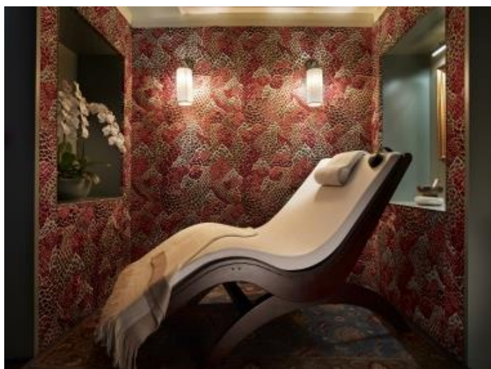
シックスセンス マックスウェル内スパポッドのリラクゼーションルーム 高解像度の画像はこちらからダウンロードしてください。