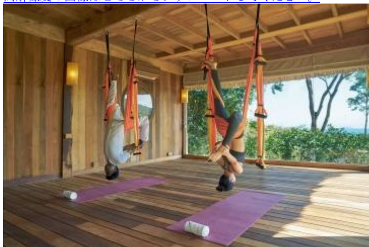
空中ヨガスタジオ