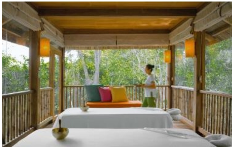
改修後のトリートメント・パビリオン

ホリスティックなウェルネスプログラムは、USD 650 (1室1名様ご利用)、USD 910 (1室2名様ご利用)よりご利用いただけます。詳細及びご予約は、シックスセンス スパ ニンバンベイ (Tel: +84 258 372 8222) または、 reservations-ninhvan-spa@sixsenses.com までお問い合わせください。