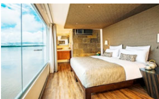
アクア・アマゾン

アクア・エクスペディションズに関する詳細は、 www.aquaexpeditions.com よりご覧いただけます。