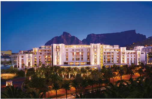
One&Only Cape Town

ラグジュアリーなバハマの最高級リゾート、 One&Only Ocean Club はトラベル+レジャー誌の選ぶワールド・ベスト・アワードにおいて、“カリブ海・バミューダ・バハマのベスト・リゾート”の第6位に選ばれました。リゾートではハートフォード・ウイングの改修を始めており、完成時にはゲストルームとスイートは大きく広く生まれ変わります。またジャン・ジョルジュ・ヴォンゲリヒテンのレストラン「デューン」の拡張工事でダイニングオプションはさらに広がり、さらにビーチフロントにプールも完成する予定です。バハマのベストビーチを見下ろす One&Only Ocean Club は、時空をも超越したエレガントなデスティネーションとして、カップルのゲストにも、またご家族連れのゲストにもふさわしいリゾートです。