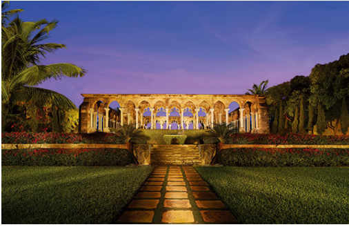
One&Only Ocean Club

ラグジュアリーなバハマの最高級リゾート、 One&Only Ocean Club はトラベル+レジャー誌の選ぶワールド・ベスト・アワードにおいて、“カリブ海・バミューダ・バハマのベスト・リゾート”の第6位に選ばれました。リゾートではハートフォード・ウイングの改修を始めており、完成時にはゲストルームとスイートは大きく広く生まれ変わります。またジャン・ジョルジュ・ヴォンゲリヒテンのレストラン「デューン」の拡張工事でダイニングオプションはさらに広がり、さらにビーチフロントにプールも完成する予定です。バハマのベストビーチを見下ろす One&Only Ocean Club は、時空をも超越したエレガントなデスティネーションとして、カップルのゲストにも、またご家族連れのゲストにもふさわしいリゾートです。