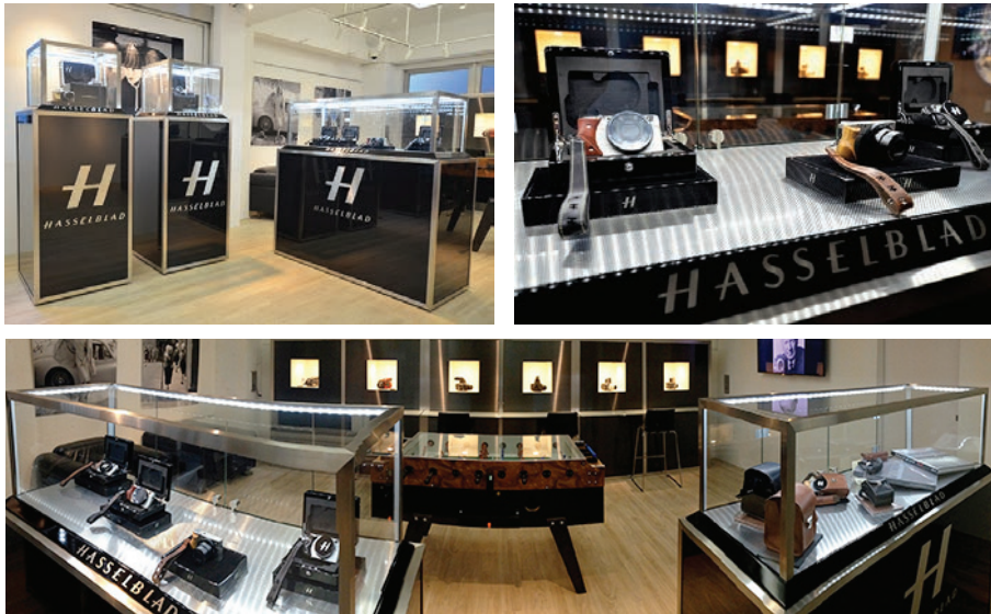
The new Hasselblad Tokyo Store