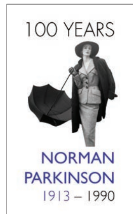
ノーマン・パーキンソン ロゴ