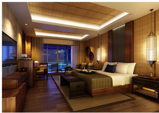
Anantara Sanya Resort & Spa

アナンタラ三亚・リゾート&スパ は、中国南部に位置する海南島の最南端、小東海に面した静かな鹿回頭半島に位置します。ラグジュリーなこのプロパティでは122のゲストルームと20のプールヴィラが小東海湾と鹿回頭湾の2つの海に面し、さらに1000メートル以上続く海岸線を望みます。三亚の有名な観光スポット、鹿回頭公園は半島を見下ろす位置にあり、1000年前より伝わるロマンチックな伝説の場所であるのみでなく、広大な海やなだらかな山々、そしてわずか3km先に見える三亚の壮大な町並みもお楽しみいただけます。