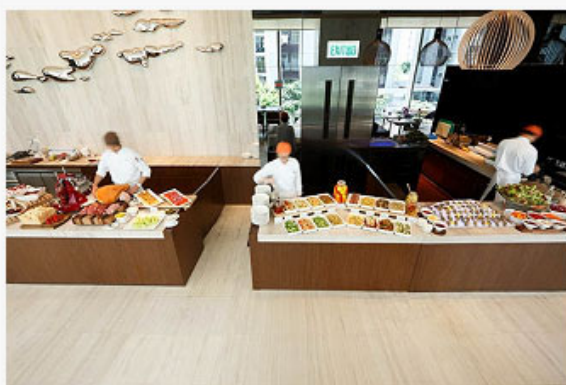
Feast - Antipasti station

「実質的な料理...むやみに飾り立てたりしない、地に足がついた料理」として国際的に注目を浴びている「ダウン・トゥー・アース・クッキング」が、EAST のオールデイ・カジュアルダイニング、Feast (Food by EAST)に登場しました。