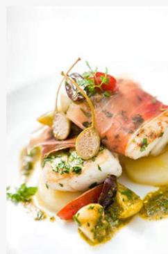
Crispy Sea-bass Fillet