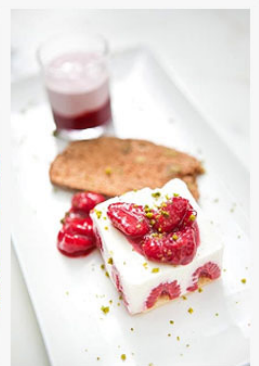
White Chocolate Mousse