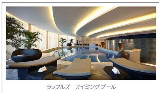
ラッフルズ スイミングプール

10の多機能トリートメントルームは、マッサージ、フェイシャルエステ、マニキュア・ペディキュアにご利用いただけます。また、広々とした2つのリラクゼーションラウンジは、フット・リフレックソロジーとマニキュア・ペディキュア専用スペースです。