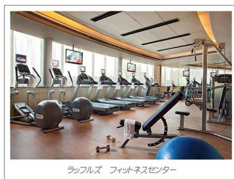
ラッフルズ フィットネスセンター

シャンプー、コンディショナー、パフュームなどのプロダクトはすべてラッフルズのオリジナルブランドで、ラッフルズスパがアロマセラピー、アーユルヴェディック医学、植物学と海洋生物学の専門家と共に開発したものを使用しています。これらの五感を刺激するプロダクトは天然素材のみを用い、敏感肌の方にも安心してお使いいただけ、体と心のバランス調整を促します。ホテル滞在中のみならず、ギフトとして持ち帰り、ご自宅でも心身のバランス調整にお役立ていただけます。