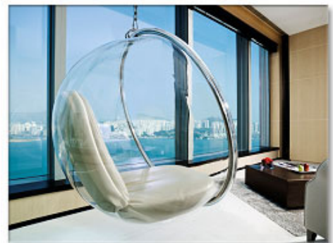
Harbor View Suite